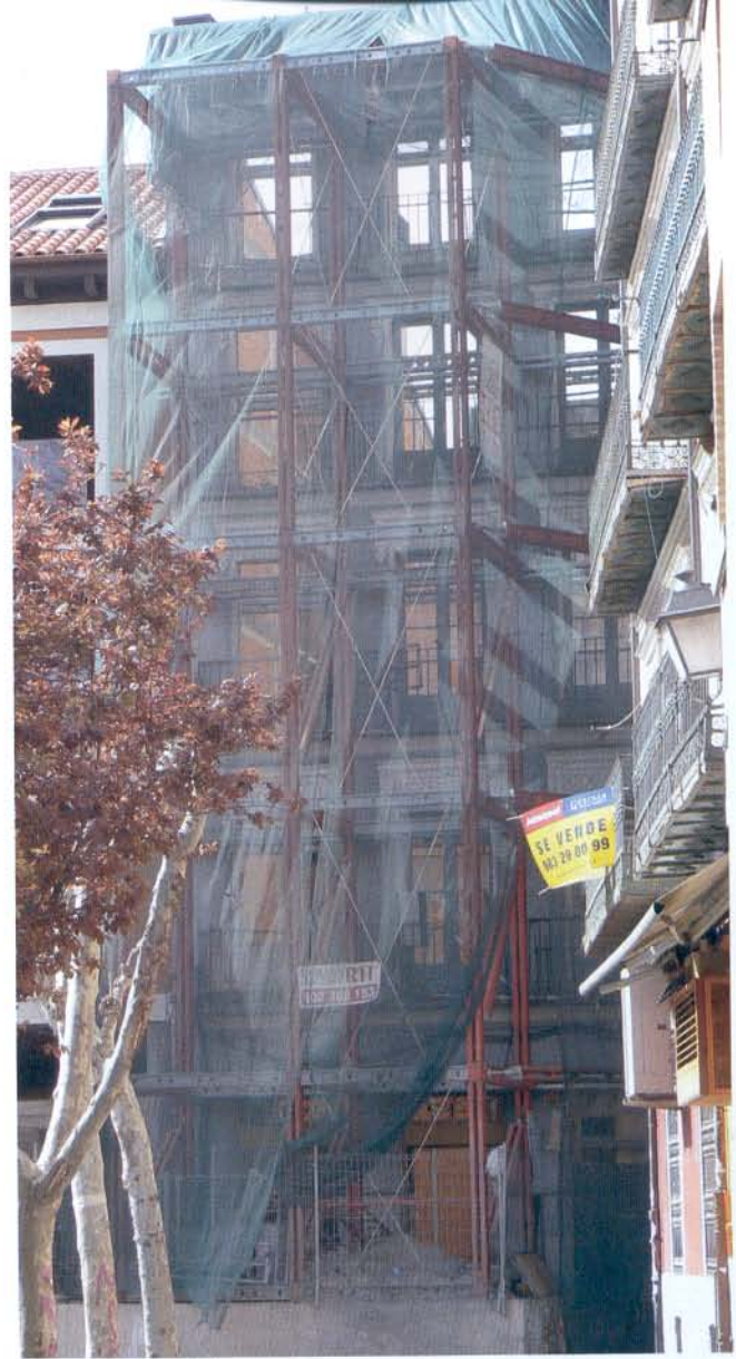
El mayor problema de derroche energético que tiene Europa es el correspondiente a todo el parque de viviendas ya construido.

Así, desde la asociación insisten en que la solución más racional para disminuir el consumo de energía en las viviendas es "evitar que se pierda el calor en invierno y que no entre en verano", y para ello, el aislamiento térmico se presenta como la mejor solución, ya sea en edificios de nueva construcción o en viviendas ya construidas, a través de la rehabilitación energética. Sin embargo, recordó Alonso, "la aplicación de materiales de aislamiento es la asignatura pendiente; hay pocos expertos cualificados para la rehabilitación, que es el problema, porque de los edificios nuevos ya se encargan las empresas promotoras, y lo están haciendo bien". Por otra parte, y aunque el Estado "ha hecho un esfuerzo importante en la normativa fruto de la Directiva Comunitaria, ésta no está traspuesta del todo, ya que aún falta el Real Decreto de Certificación Energética de