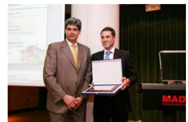
Premio a la Mejor Instalación Domótica