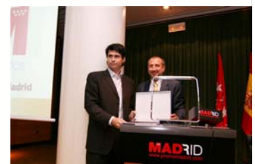
Premio a la Mejor Instalación Inmótica

1ª ENTREGA DE PREMIOS A LA MEJOR INSTALACIÓN DOMÓTICA E INMÓTICA DE LA COMUNIDAD DE MADRID