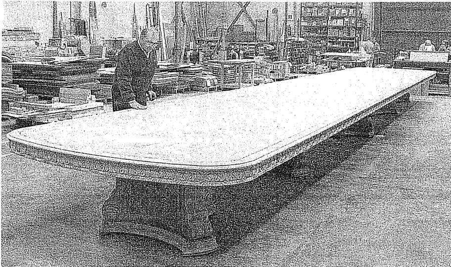
Un artesano comprueba uno de los procesos de fabricación y montaje de la elegante mesa clásica.