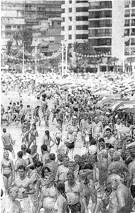
Playa de Benidorm llena de turistas.

El Ejecutivo admite, en una respuesta parlamentaria al diputado popular Antonio Erías, que el incremento del IVA a partir de julio «puede tener impacto» en el sector turístico español, «al igual que en el resto de sectores económicos», pero